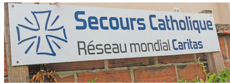
Le Secours catholique organise, comme chaque année, une braderie avec « des jouets et livres pour enfants à tout petits prix ».

À Maurepas, deux événements caritatifs organisés par le Lions club et le Secours catholique se tiendront le samedi 13 décembre.